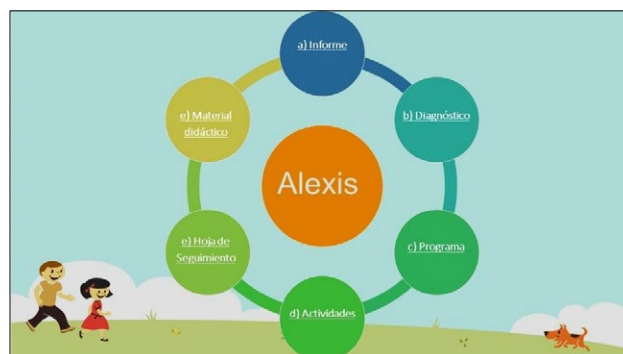
Figura 1. Elementos que conforman el informe, tabla con hipervínculos

Nota: El nombre Alexis es solo un ejemplo y no corresponde a la identidad de ninguna persona participante.