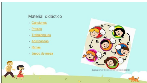
Figura 2. Presentación de Material didáctico