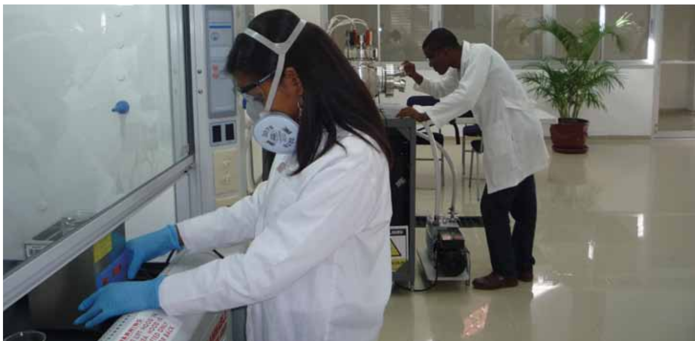
Laboratorio de Nanotecnología de la Pontificia Universidad Católica Madre y Maestra, Santiago de los Caballeros, República Dominicana.